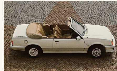
Echter Viersitzer, Bewegungsfreiheit auf allen 4 Plätzen.