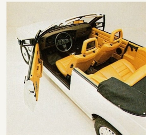
Materialien und Lederausstattungen.