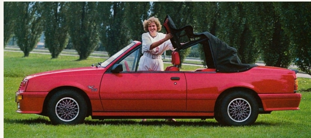
Leichtgängige voll versenkte Öffnungs- und Schließmechanik.

In modernen Produktionsstätten wird der Ascona aufs Aufwendigste zum Cabriolet umgebaut. Die notwendigen Versteifungen der Karosserie wurden so in das Gesamtkonzept eingebaut, daß ein echtes 4-sitziges Voll-Cabriolet entstand.