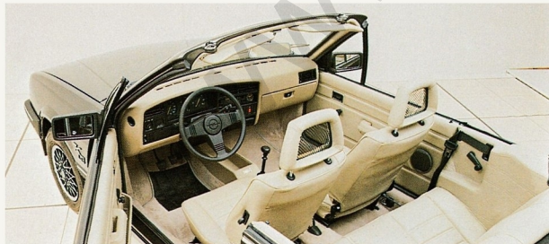
Ganz auf Ihre Wünsche abgestimmte Innenraumgestaltung in verschiedenen

Leistung und Raumangebot machen dieses Voll-Cabriolet zum idealen Reisewagen. Die elegante Karosserie, eine gelungene Synthese von Sportlichkeit und Eleganz, wird in seiner Linienführung mitbestimmt durch die voll versenkbaren hinteren Scheiben und das nahezu ganz in die Karosserie versenkte Dach. Das Keinath KC 3 Cabriolet ist eine ausgereifte Konstruktion. Ein Auto für Anspruchsvolle, an dem Sie lange Freude haben werden.