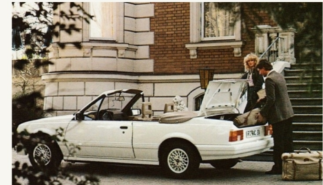
Großer Kofferraum für viel Gepäck.